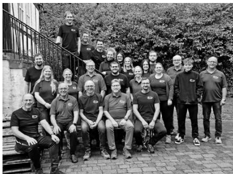
Schneeberger Musikanten