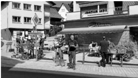
Fäggerli fuggern 2018

AUFRUF AN ALLE – Am Samstag, den 27. April 2024 veranstaltet der Obst- und Gartenbauverein Kirchzell ab 9.00 Uhr, „Fäggerli fuggern“, den „7. Pflanzenflohmarkt“ für Jedermann/Frau!!! rund ums alte Rathaus