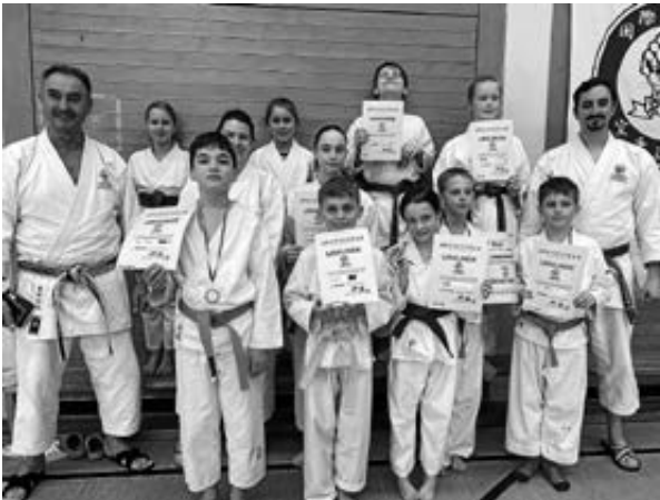
Teilnehmende des Lehrgangs in Mosbach.

Am 16.03.2024 nahm der Goju-Ryu Karateverein Amorbach e.V. an einem Kata-Vergleichswettkampf des IGKR e.V. teil. Die Veranstaltung fand unter der Teilnahme zahlreicher Dojos und Vereine in Mosbach statt. Für insgesamt 14 Teilnehmende aus Amorbach, darunter 10 Kinder unterschiedlichen Alters und verschiedener Kyu-Grade, startete der Tag mit einem gemeinsamen Training und Aufwärmen unter der Leitung von Hanshi Tokio Funasako.