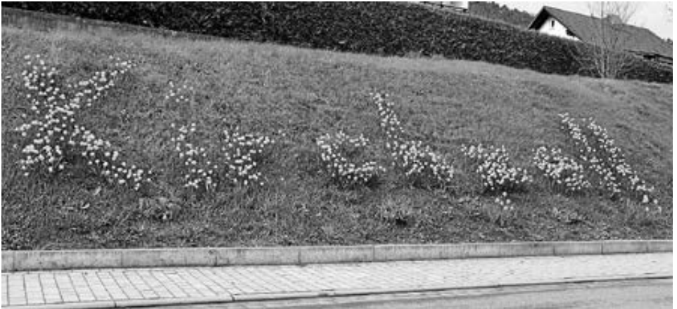
Blütengruß in Kirchzell

Informationen gibt es unter 06152-86459.