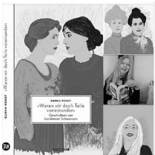
Schwestern Foto: Reclam Verlag