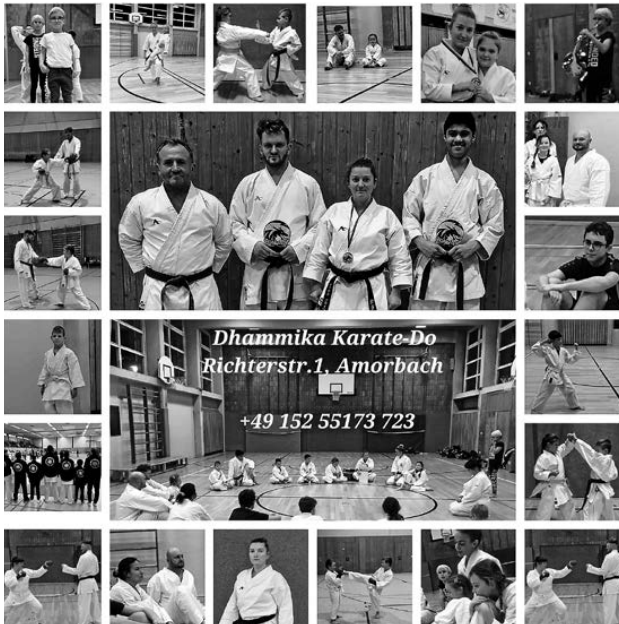
Bild zeigt Vereinsmitglieder von Dhammika Karate-Do Amorbach e.V.

Seit nun mehr genau vier Monaten besteht der Dhammika Karate-Do Verein in Amorbach. Anlass für die Trainer und Gründer des Vereins Oxana Traiber, Viktor und Oleg Osijuk im Rahmen des letzten Trainings am 22.12.23 auf große Erfolge und Errungenschaften zurück zu blicken und natürlich eine kleine vorweihnachtliche Feier abzuhalten. Hierzu hatten sich die Verantwortlichen etwas besonderes einfallen lassen für die zahlreichen Kinder und Erwachsenen, die zu dieser Trainingseinheit anwesend waren.