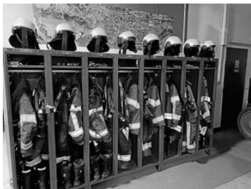
Neue Spinde und Helme für die FFW Schneeberg

Das Feuerwehrhaus in Schneeberg wurde für 6.000 € mit neuen Spinden für die Einsatzkräfte ausgestattet. Außerdem entsprechen die Schutzhelme der drei Feuerwehren nicht mehr den gesetzlichen Vorgaben.