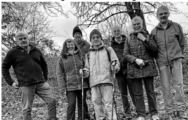
Auf der Winterwanderung in Beuchen