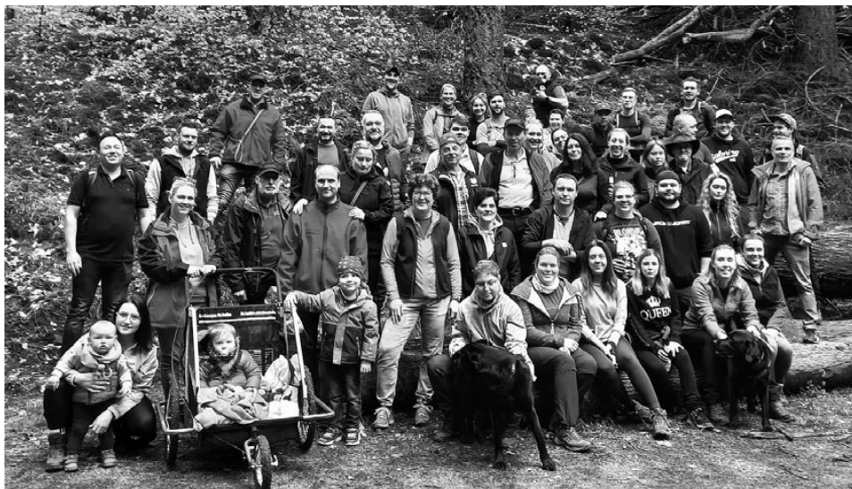
Autor: Andreas Dönicke, Carneval Club Amorbach; Bild: Norbert Jahn

Besonderen Dank an den Obst- und Gartenbauverein Amorbach für die ausgezeichnete „Verstärkungsstation“ an der Apfelallee.