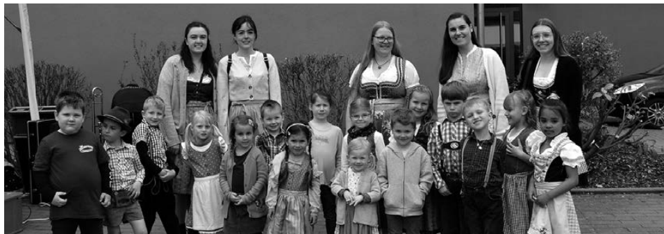
Bild oben: Die Kinder der musikalischen Früherziehung bei Maibaumfest

Und zwei Wochen später dann das Maibaumfest. Der Terminkalender hat es zugelassen und so wurde der Maibaum wieder festlich begrüßt. Zum Proben war wenig Zeit und die Musikermansschaft war aus privaten Gründen dezimiert. Dennoch war es für alle Gäste und uns Musikanten wieder ein schöner gelungener Abend. Auch die Kinder der musikalischen Früherziehung hatten dabei wieder einen fröhlichen Auftritt.