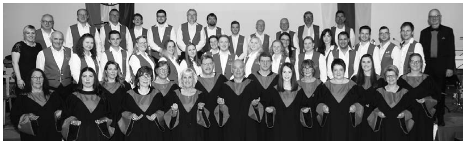
Bild oben: Für das Jubiläumskonzert gegründete Gospelchor unserer Musikerfrauen

Und zwei Wochen später dann das Maibaumfest. Der Terminkalender hat es zugelassen und so wurde der Maibaum wieder festlich begrüßt. Zum Proben war wenig Zeit und die Musikermansschaft war aus privaten Gründen dezimiert. Dennoch war es für alle Gäste und uns Musikanten wieder ein schöner gelungener Abend. Auch die Kinder der musikalischen Früherziehung hatten dabei wieder einen fröhlichen Auftritt.